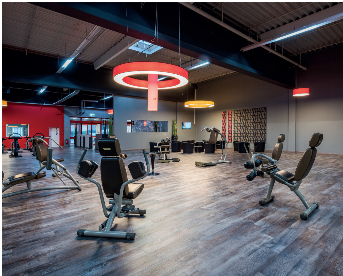
Ein Blick in den Trainingsraum