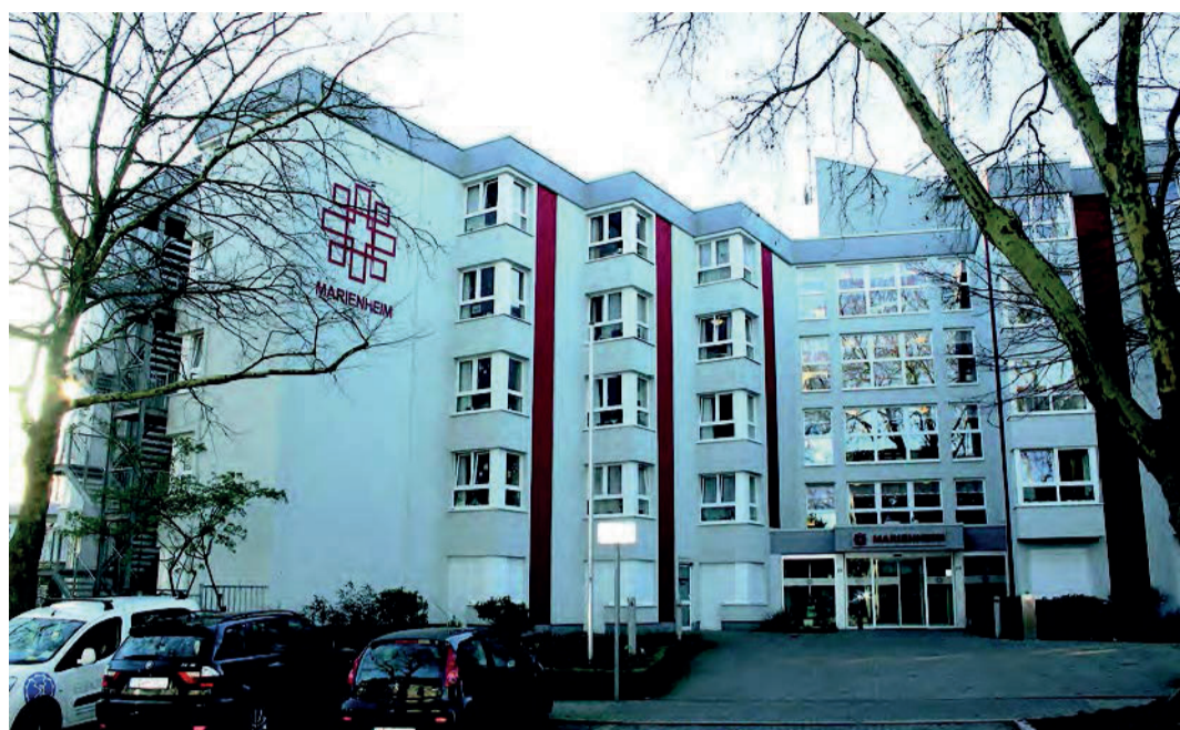
Zweites Marienheim am Hinseler Hof 24 - Foto von 2014.