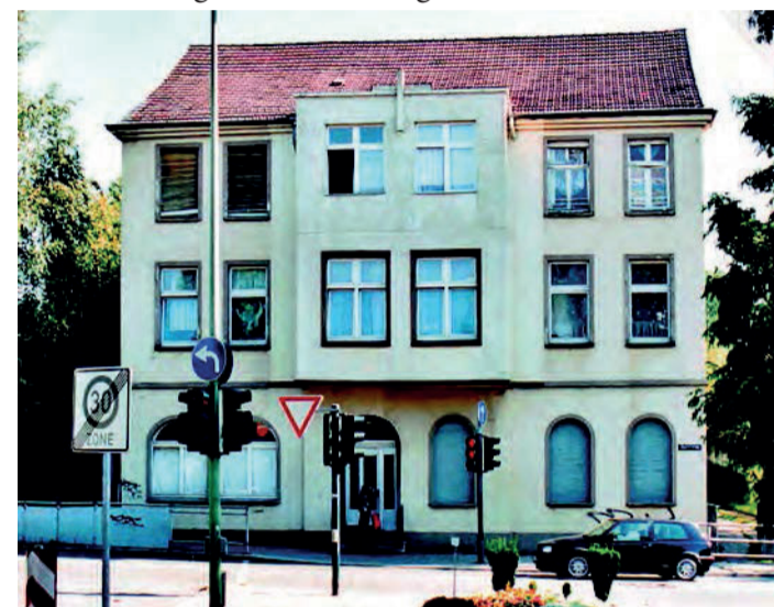
Erstes Marienheim an der Überraehrstraße 159 - Foto von 1989.

Jahre 2004 änderte sich die Rechtsform des neuen Marienheimes. Hauptgesellschafter ist nun die Theresia-Albers-Stiftung, Hattingen, die auch die unmittelbare Verantwortung für die Führung des Hauses trägt. In den darauffolgenden Jahren wurde das Haus komplett neu gestaltet. Aus der Altenwohnstätte ist ein modernes Altenpflegeheim geworden.