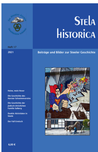
Cover Stela Historica

Seit Bestehen des Steeler Archivs präsentiert der Verein jährlich ein Geschichtsmagazin