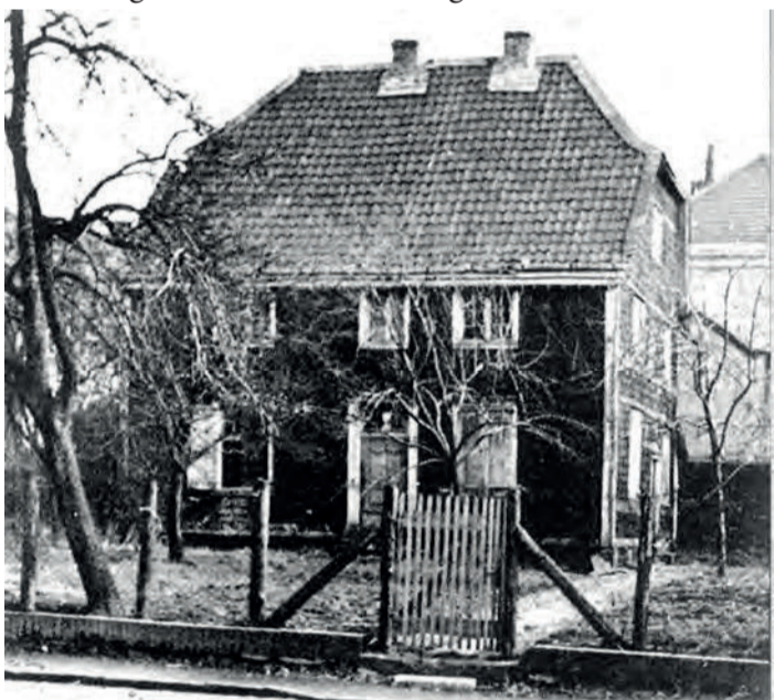
Pfarrhaus von 1803.

Weil das alte Marienheim im Zuge der Erweiterung der Überraehrstraße abgerissen werden sollte, bemühte sich die Kirchengemeinde St. Mariä Heimsuchung rechtzeitig darum, ein neues Altenheim zu planen und auf dem Grundstück der im Jahr 1969 abgerissenen alten Kirche von 1874 an der Straße Hinseler Hof zu bauen. Architekt des neuen Marienheimes war Rolf Grundmann aus Rellinghausen. Nach dem am