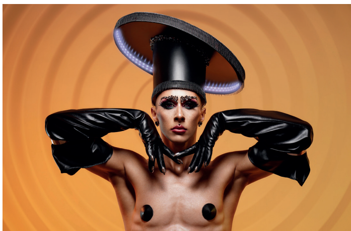
Majestic Luxor Strapaten, Hula-Hoop & Boylesque