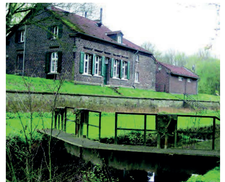
Schleusenwärterhaus mit Wirtschaftsgebäude

Mit den letzten Transporten im Jahr 1890 wurde die Ruhrschif- fahrt oberhalb von Mülheim eingestellt.