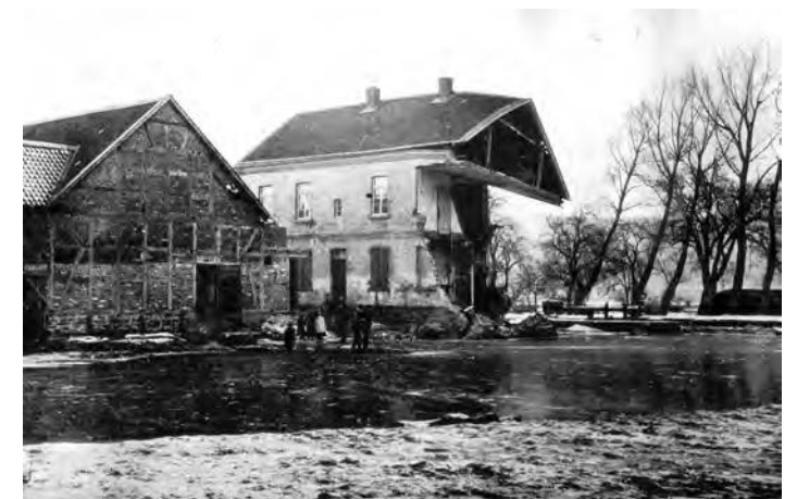
Schleusenhaus Platte nach Hochwasser 1890

Für Ihre Heimat- und Stadtteilforschung ist die Übrerruhr Bürgerschaft weiterhin auf der Suche nach alten Fotos und/ oder Textmaterial zum Stadtteil Übrerruhr. Wer so etwas zur Verfügung stellen kann, ist herzlich eingeladen, das beim stellvertretenden Vorsitzenden der Bürgerschaft, Stephan Assenmacher, Krummecke 8, 45277 Essen, zu tun. Kontakt: Mobil-Tel.: 0176-631 58 318 oder per E-Mail: stephan.assenmacher@web.de